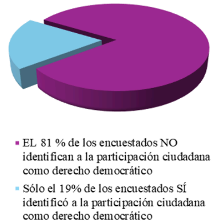
DEL 82 % QUE DIJO SABER CUÁLES SON SUS DERECHOS DEMOCRÁTICOS

Gráfica No. 3 que esquematiza que del 82% de los ciudadanos que dijeron Sí saber cuáles eran sus derechos democráticos, sólo el 19% identificó a la participación ciudadana como derecho democrático.