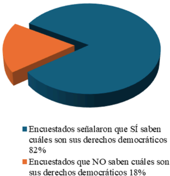
DE LOS 385 ENTREVISTADOS

Gráfica No. 2 que esquematiza cuántos de los entrevistados señalaron que Sí sabían, y cuántos que NO sabían, cuáles eran sus derechos democráticos.